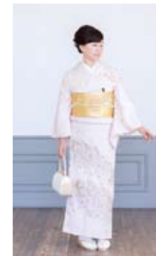
友人・親戚の結婚式に