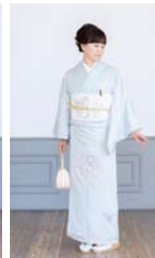
お子様の卒入學式に