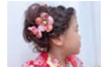
洋風ヘアもキュート♪