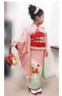
凛とした装い、七歳の着物