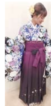
卒業式はシックな袴姿