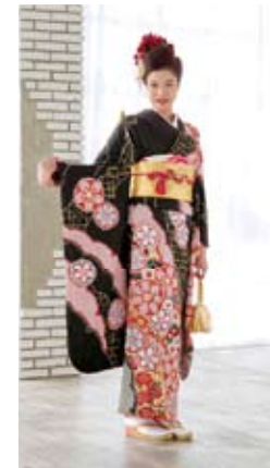
華やかで艶やか。振袖姿は格別