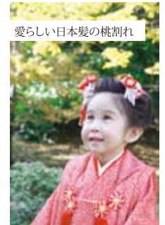
愛らしい日本髪に桃割れ