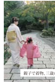
親子で着物、三歳の被布