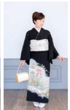
美しく着こなす黒留袖